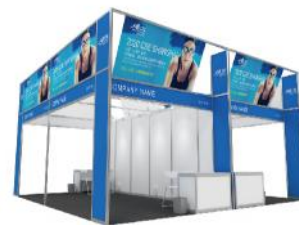
精装展位 9m 2 ( 3m×3m )