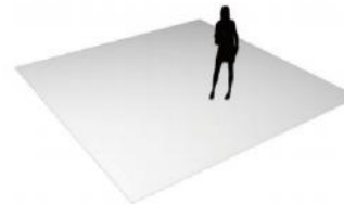
光地 ( 36m 2 起租 )