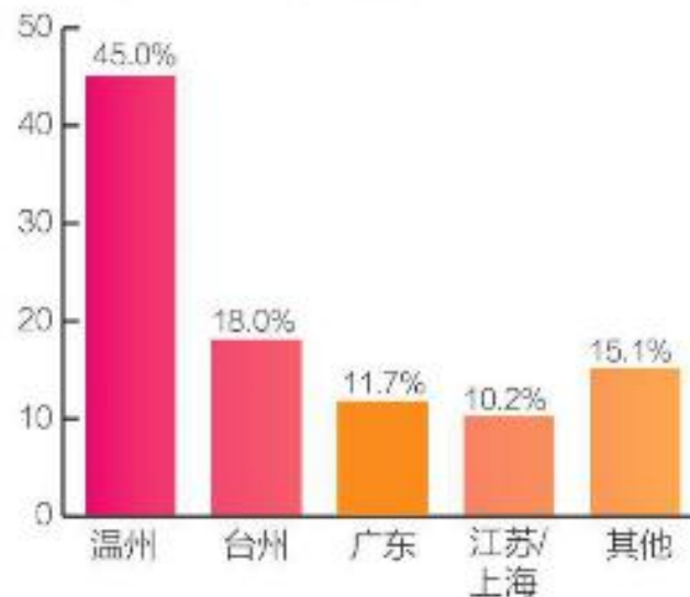
参展企业地域来源