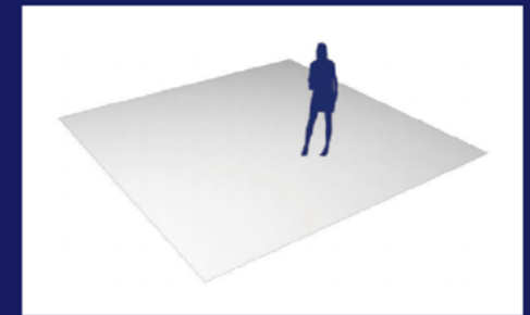
光地 (36m 2 起租)