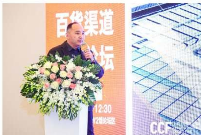
CCF 上海日用百货展 CHINA CONSUMER GOODS FAIR