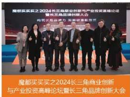
魔都买买买之2024长三角商业创新与产业投资高峰论坛暨长三角品牌创新大会