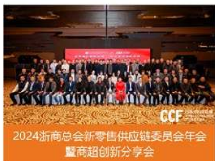
2024浙商总会新零售供应链委员会年会暨商超创新分享会