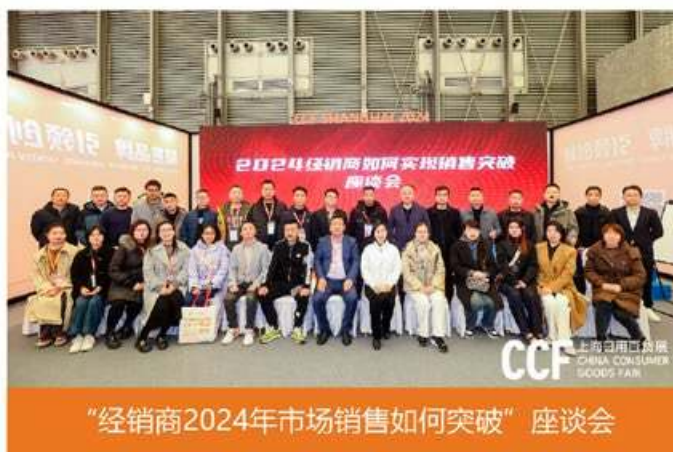
“经销商2024年市场销售如何突破”座谈会