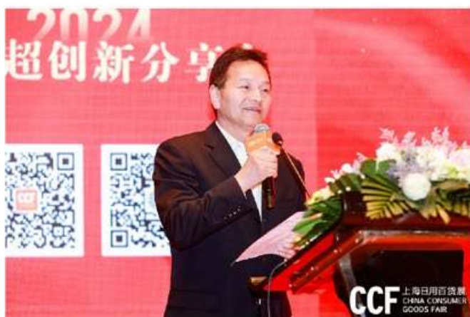
CCF 上海日用百货展 CHINA CONSUMER GOODS FAIR