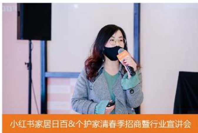
小红书家居日百&个护家清春季招商暨行业宣讲会