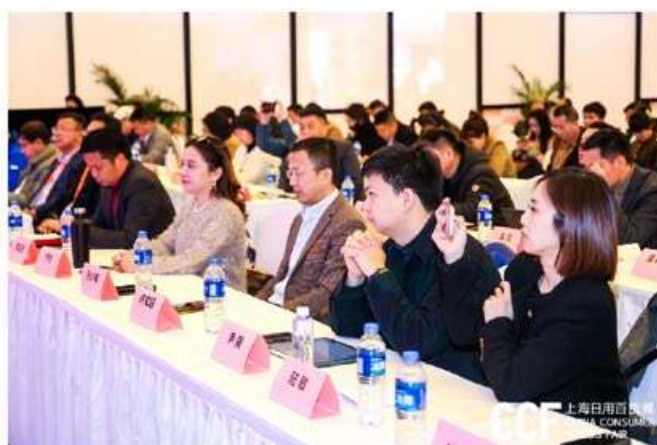
CCF 上海日用百货展 CHINA CONSUMER GOODS FAIR