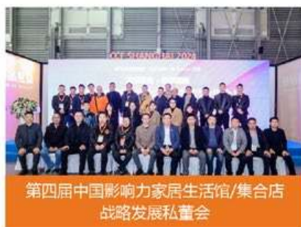
第四届中国影响力家居生活馆/集合店战略发展私董会