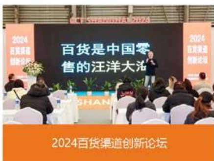
2024百货渠道创新论坛