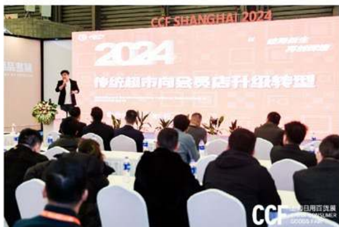
CCF 上海日用百货展 CHINA CONSUMER GOODS FAIR