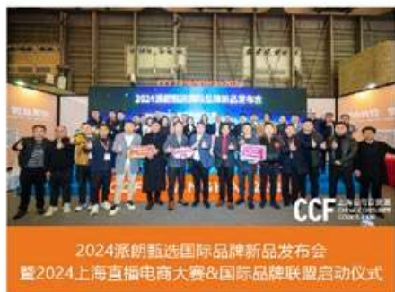
2024派朗甄选国际品牌新品发布会暨2024上海直播电商大赛&国际品牌联盟启动仪式