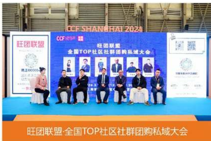
旺团联盟·全国TOP社区社群团购私域大会