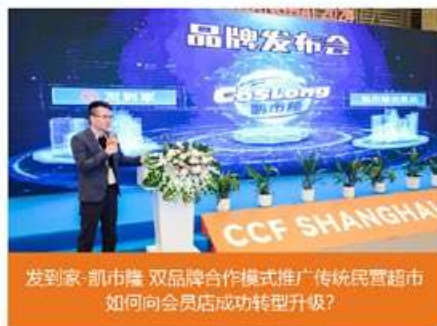
发到家·肌市隆 双品牌合作模式推广传统民营养馆市如何向会员店成功转型升级?